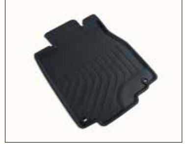
Велюрові килимки салону