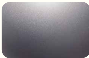
Alabaster Silver Metallic