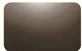
Urban Titanium Metallic