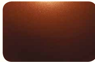
Cooper Sunset Pearl