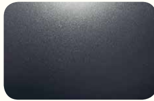
Modern Steel Metallic