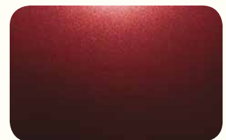
Basque Red Pearl