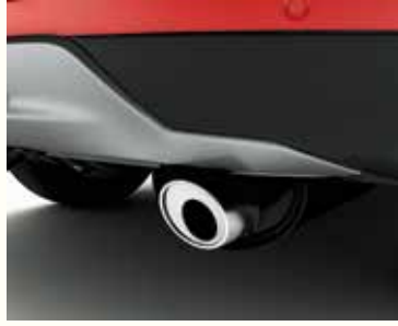
Насадка на глушник