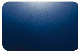
Obsidian Blue Pearl