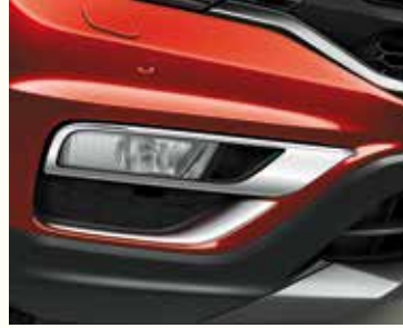
Накладка на протитуманні фари