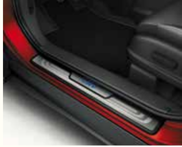
Декоративні пороги з підсвіткою